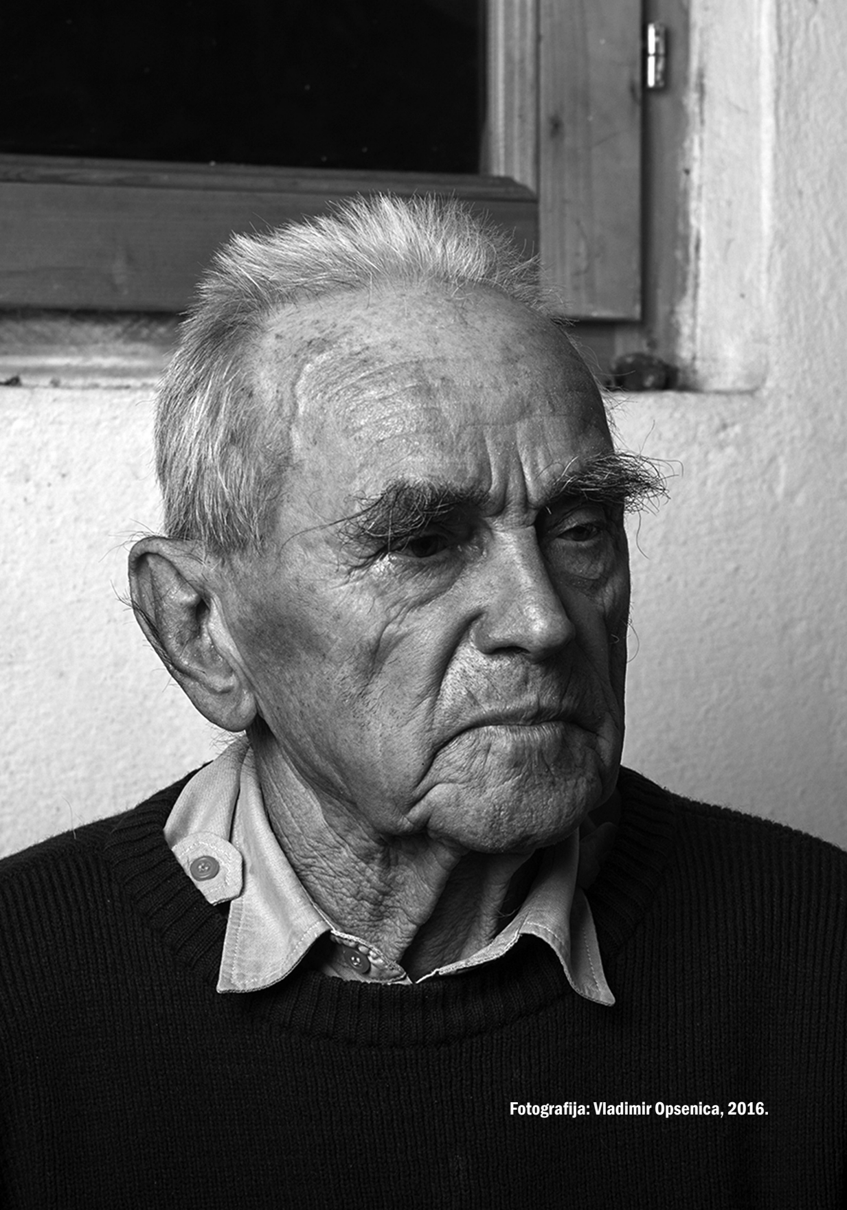
Fotografija: Vladimir Opsenica, 2016.