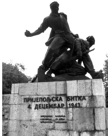
Spomenik 4. decembar - posvećen Prijepoljskoj bitci koja se dogodila 4. decembra 1943. godine. Delo je vajara Lojza Dolinara.

Zato što su borci se borili, branili da ne prođu. Žestoka je borba bila. Tenkovi su dolazili do same te bolnice, i topovima tukli, i razrušili to. Jedna partizanka je stala na prozor: „Udri, Švabo, ima nas još živije!” Ovi su drugovi je sklonili, ona poginula tu odma'. Borili se ceo dan. I Nemač je pošô s motorom, i na tom motoru bio još jedan u onoj prikolici. I ovi ga su ubili. Drugi partizan obuče onaj čaršaf bijeli, priđe do toga, uzme šarac, donese 'vamo, pa se ponovo vrati te uzme dva sanduka municije, tako da su mogli da se bore ceo dan. E, kad je već mrak uhvatio, pokušavali su oni kol'ko puta da izađu uz taj potok gore, ali nisu mogli. Ali na Gradini, na Gradini je bio mitraljez partizanski. I tukô je isto na most. Mnogo boraca je pokušavalo preko Lima da prijeđu, ali nisu mogli. Dolazili bi do Lima, opet se vraćali gore na Sokolicu. Neki su uspjeli da pređu prijeko Lima, neki su utopili se, neki... i tako. Uglavnom, na spomeniku stoji četiri stotine devedeset sedam imena poginulih, ali to nije samo u Prijepolju taj dan, nego i prije toga, za vrijeme borbe oko Prijepolja.