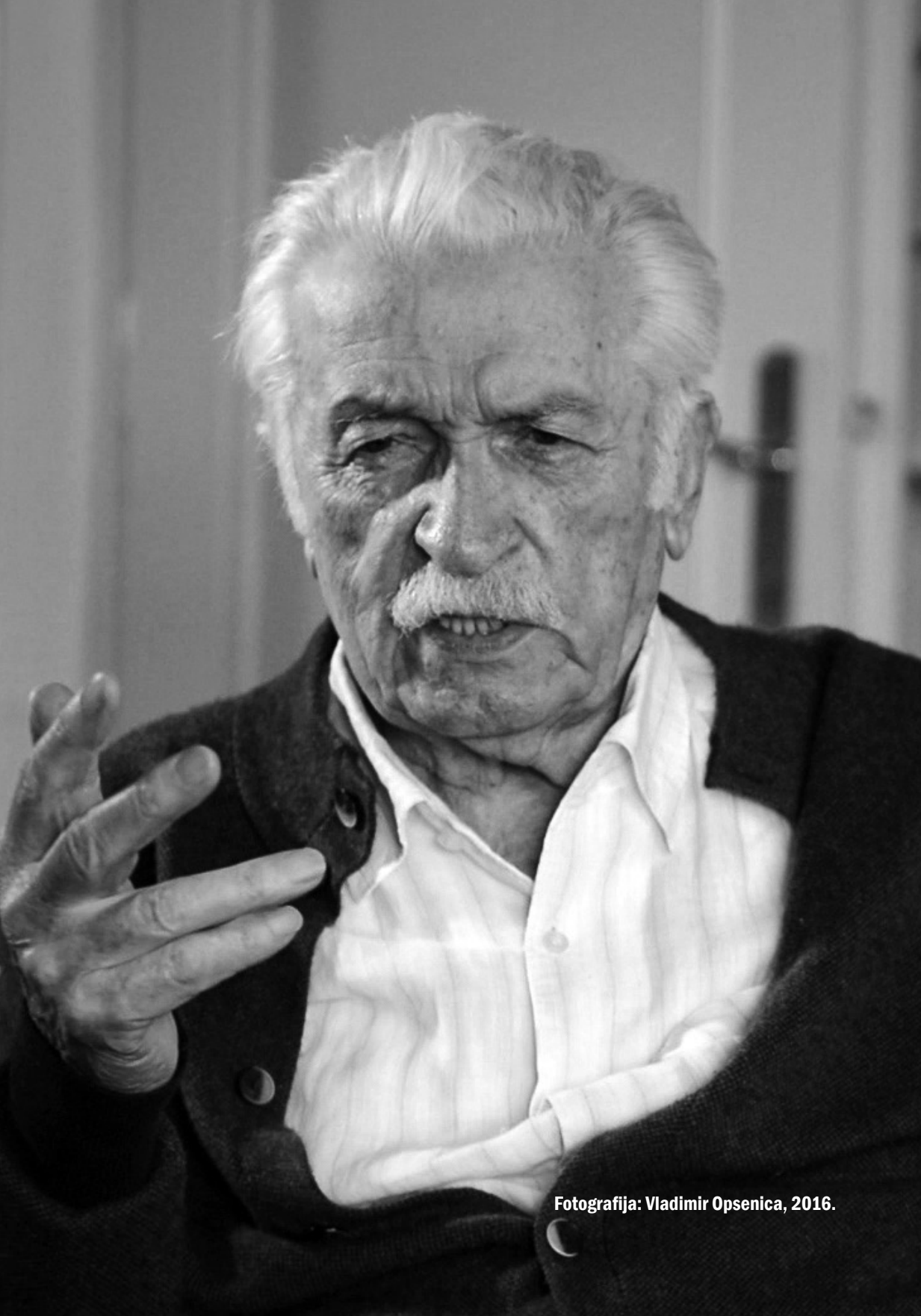
Fotografija: Vladimir Opsenica, 2016.